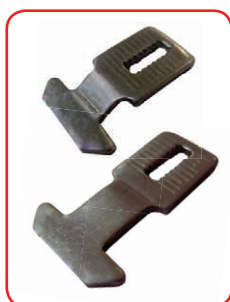
LINGUETES INCLUÍDOS GANCHOS INCLUSOS